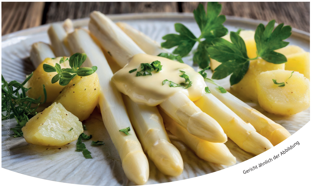
Gericht ähnlich der Abbildung